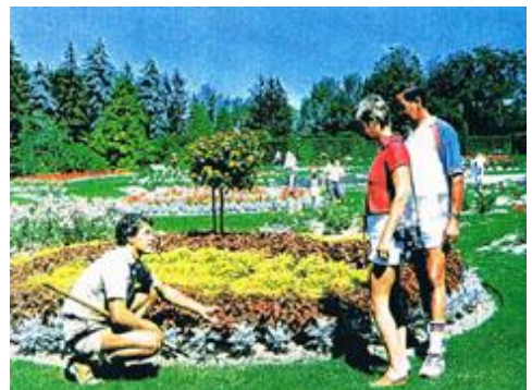
学生と訪問者との語らい