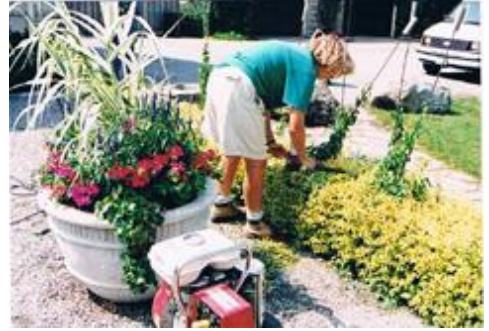
園芸実習中の生徒

植林、植物学、管理学、英語、昆虫学、草花栽培、果樹・野菜栽培、温室、環境と生産、観賞用植物の生産、園芸化学、園芸ゼミナール、植物病理学、土壌芝生管理、実地訓練等の全科目が必須。