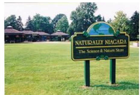
売店もあるビジターセンター