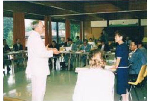
園芸学校で校長先生から説明を受ける

(2) ナイアガラ・ボタニカルガーデンの概要 面積は40ha。施設として、樹木園、バラ園、ハーブ園のほか植物や野菜の展示室等がある。