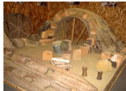
登窯の伝統的な築き方（同左）