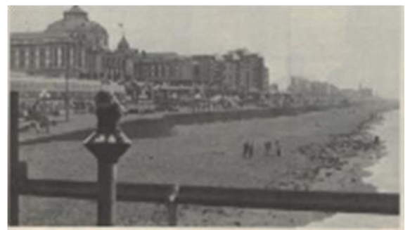
海浜とクールハウス

サーカス劇場では、キャバレーのショーからオペラまで、バレエから演劇までさまざまな文化的な催しが聞かれている。