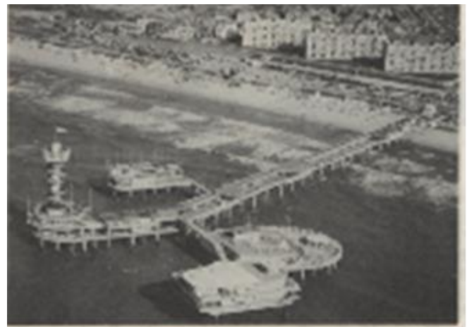
スヘベニンゲンのピアとシーサイドリゾート施設

その後、ハーグ市営となり、1885年に市営ビーチハウスをオープンして、整備が進むにつれて、有名な海水浴場 (Bathing) となり、オランダ、中央ヨーロッパのみならず、はるか遠いロシアからも観光客が訪れ熱狂的な評価を得るようになった。当時は、波が病気の治療にも役立つと信じられており、スヘベニンゲンの水浴治療は、あらゆる国の上流階級にとって「北海の真珠」と呼ばれ、ユニークなビーチハウスとして名を馳せていた。海浜利用に合わせて、最初のピア (観光栈橋) が、1901年に建設され、このピアは、スヘベニンゲンの名物となった。(ピアはその後焼失し、1959年に再建された)