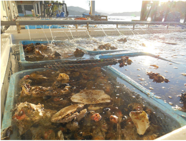
気仙沼市唐桑の牡蠣