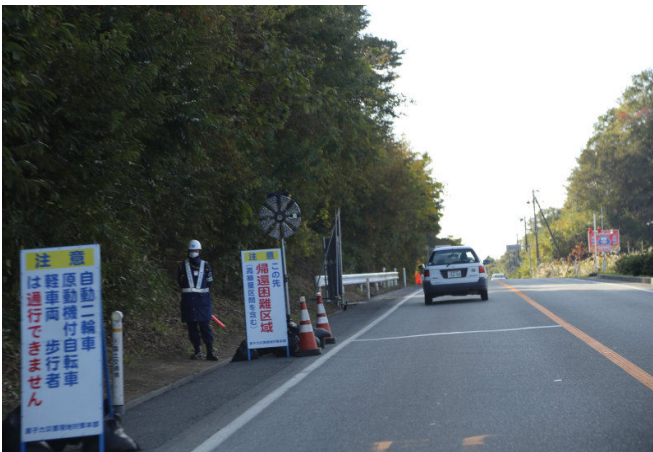
これより帰宅困難区域