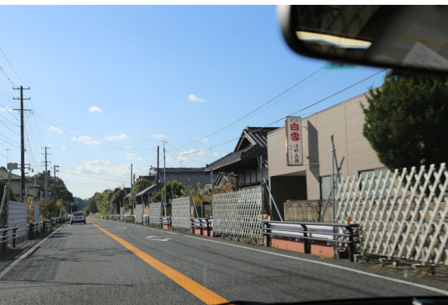
侵入防止バリケード