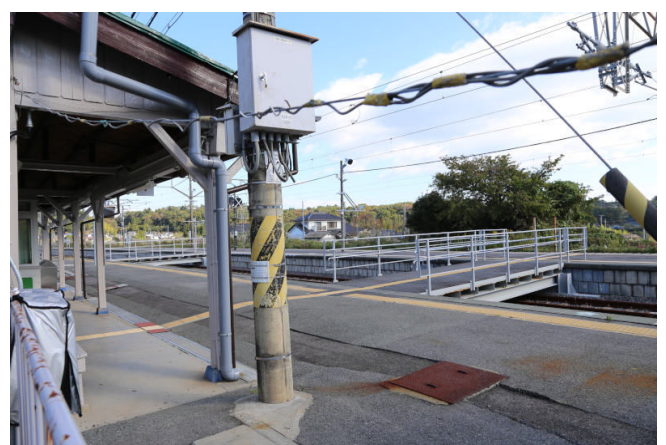
竜田駅は線路上に通路を設置