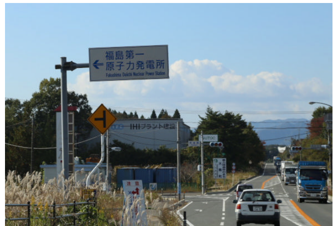
左は福島第一原発