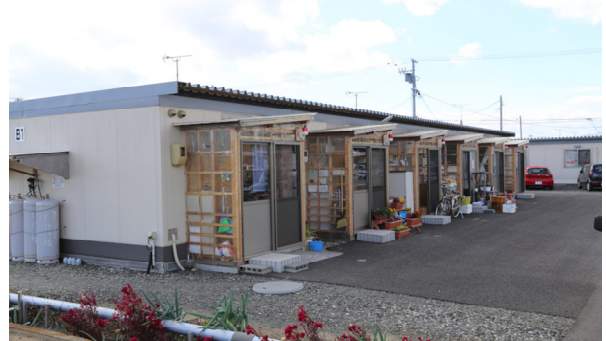
郡山市富田町若宮前 仮設住宅