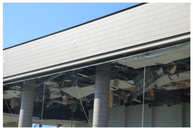
震災発生時と全く変わらず