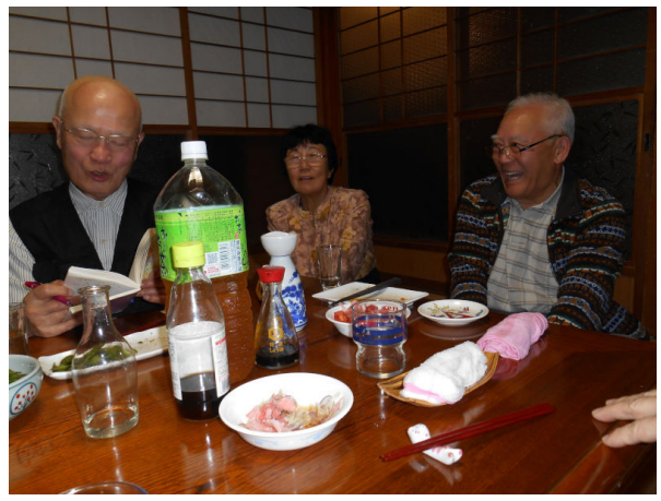
南相馬市 民宿大ちゃんで3人の友人