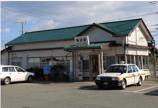
東京からは竜田駅まで開通