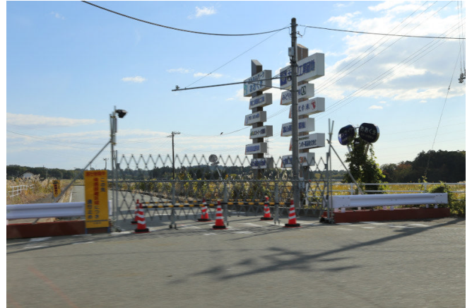
侵入防止バリケード