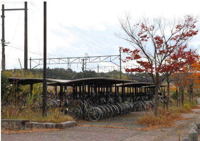
小高駅前震災当日のまま